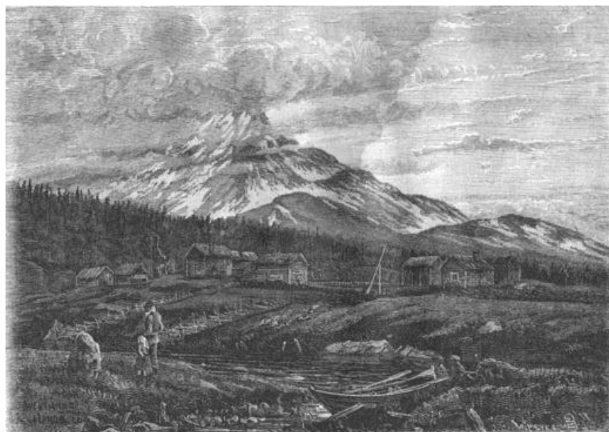
Byn Handöl vid fjällets fot

mestadels till fots och vandrade då förmodligen samma väg som såväl de medeltida pilgrimerna till Nidaros, som de mer sentida överlevande karolinerna efter dödsmarschen över fjällen, nyåret 1718-19. Handöl hade redan sedan tidigare fångat mitt intresse då det där enligt folk jag tidigare talat med skulle finnas en särdeles underlig och således säkert mäktig lapphäxa som kunde allt om "de gamla sederna". Att nu mitt sällskap med pastor Ohlsson förde mig till just Handöl var därför något jag inte beklagade.