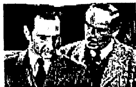
Sherlock Holmes och Kommissarie Lestrade kommer att närvarar under banketten.

En talesman ifrån Scotland Yard uppmanar, under en presskonferens, medborgarna i England att "behålla sitt lugn under natten den 30 december". Det är nämligen då Scotland