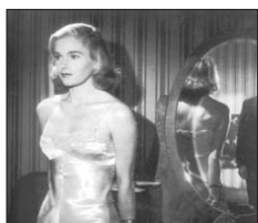
Skönhetsmiss från 20-talet

Den första tävlingen i Sverige ägde rum 1922 och anordnades av Stockholms Dagblad tillsammans med Rasbiologiska institutet i Uppsala. Arrangemanget hade som bakomliggande syftet att få fram en "äktsvensk kvinnotyp".