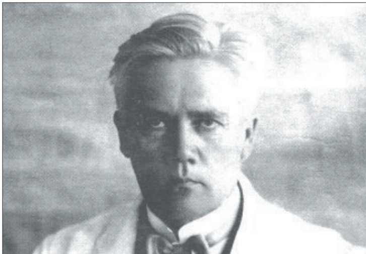
Herman Lundborg var rasbiologiska institutets chef från starten 1922 till 1936.