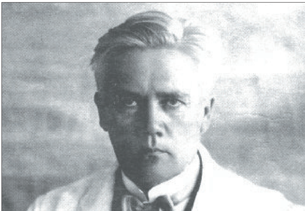
Herman Lundborg var rasbiologiska institutets chef från starten 1922 till 1936.