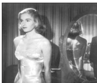
Skönhetsmiss från 20-talet

Den första tävlingen i Sverige ägde rum 1922 och anordnades av Stockholms Dagblad tillsammans med Rasbiologiska institutet i Uppsala. Arrangemanget hade som bakomliggande syftet att få fram en "äktsvensk kvinnotyp".