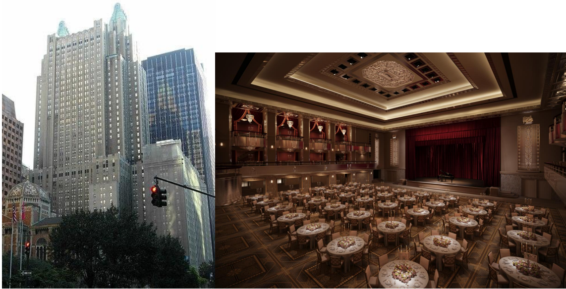
Waldorf Astoria hotel