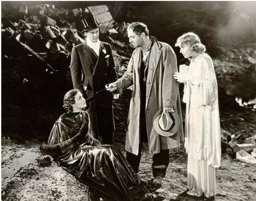
Scene fra filmen

Man kan se den her hvis man skulle have lyst: https://youtu.be/uP_r2fWBt9E?feature=shared