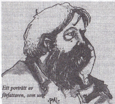
Ett porträtt av författaren, som ung