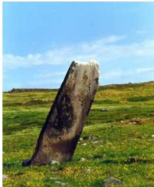
En av sejterna

Artikeln handlar om ett mycket stort cirkelformat mönster av ett tjugotal stora stenblock som författaren menar sig ha funnit på Stråten-fjället nära byn Handöl i Jämtland. Cirkeln har en diameter på drygt en kilometer. Hon menar att stenblocken är sejtar, samiska kultobjekt, som med människokraft ställts i cirkel vilket i sådana fall är mycket uppseendeväckande då sejtar vanligtvis var stenblock, eller liknande, som förts till en plats av naturens krafter för att sedan hittas och vördas av samerna. Författaren kallar cirkeln för en samisk Stonehenge och menar att ansträngningarna som krävts för att bygga den måste ha varit enorma för det decentraliserade samiska samhället. I slutet av artikeln hänvisar författaren till sin doktorsavhandling som ska vara färdig julen 2008.