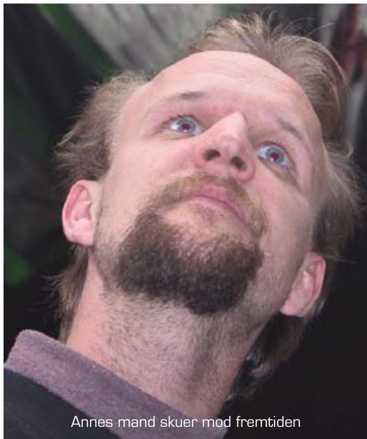
Annes mand skuer mod fremtiden

Så alt i alt mener Annes mand at dette års Fastaval har været rigtig god på næsten