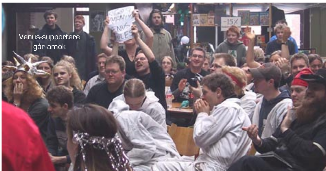
Venus-supportere går amok