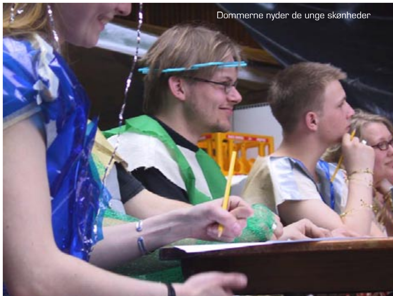
Dommerne nyder de unge skønheder