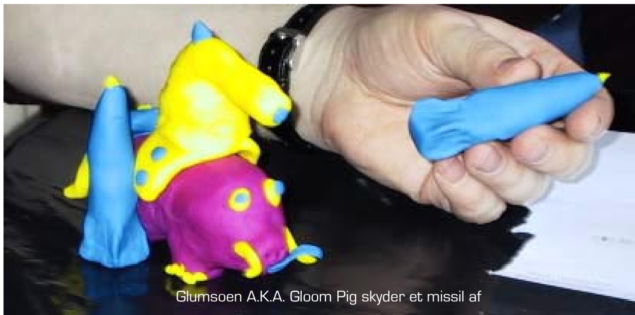
Glumsoen A.K.A. Gloom Pig skyder et missil af