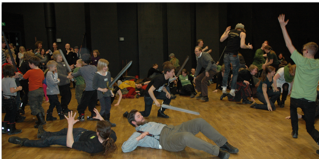
Lek med lajvare i alla åldrar under programpunkten "Barda-Karls"-bofferskola.