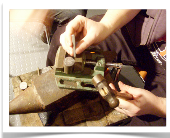
Workshop i hur man tillverkar en myntstamp.