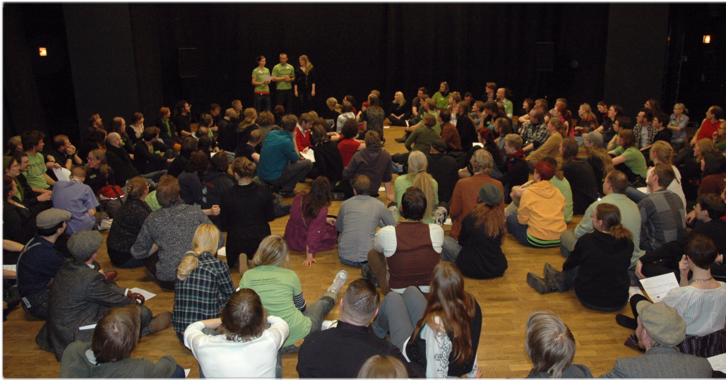
Från invigningen av Prolog | 2010.