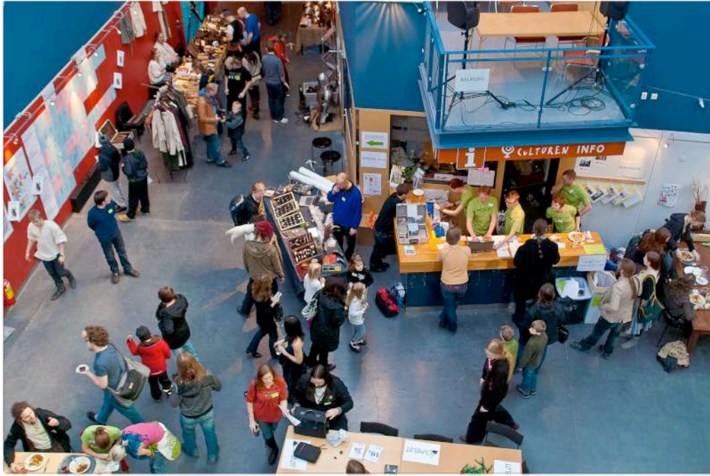
Torget och receptionen under Prolog | 2010