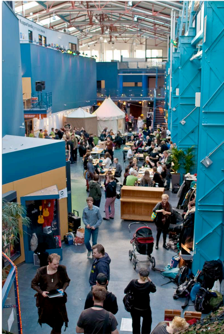
Ett välfyllt Prolog under lördagens besöksdag.

ETT SVENSKT LAJVKONVENT 5-7 MARS - VÄSTERÅS