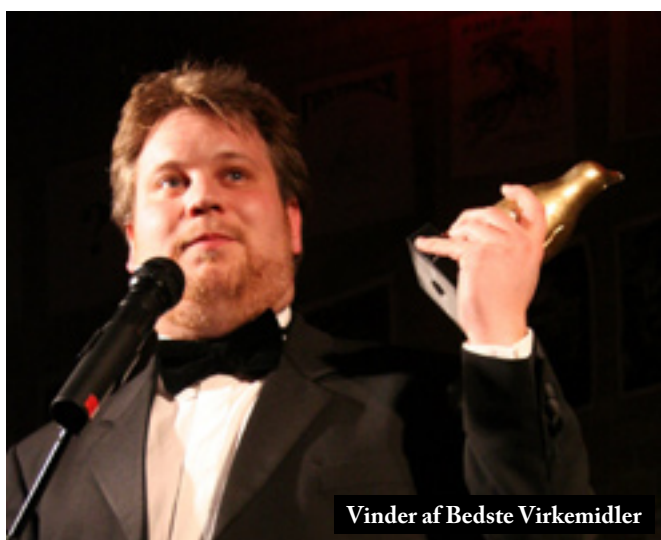
Vinder af Bedste Virkemidler

Det var dybt bevægende at stå på scenen og modtage en pris for mit sidste Fastavalscenarie. Og nu håber jeg bare at kunne bruge min erfaring og min begejstring over mediet til at hjælpe andre og nye ansigter op på podiet til champagnen og anerkendelsen.