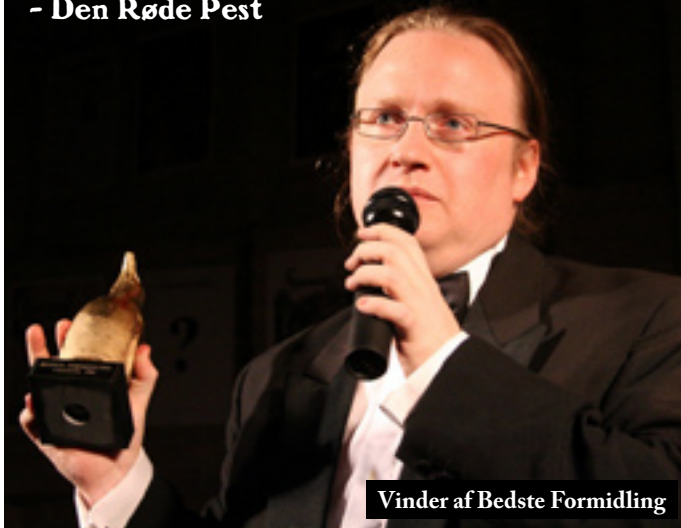
Vinder af Bedste Formidling