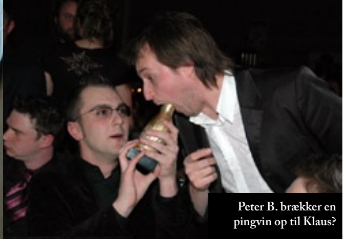
Peter B. brækker en pingvin op til Klaus?

Morsom. Rørende. Skræmmende. Voldsom. Pinlig. Imponerende. Banketten vil det hele og kan en del. Vi takker vores fotograf Anders Trolle for at fange øjeblikket